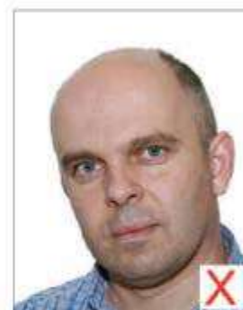
Effet de style

Le sujet doit présenter son visage face à l'objectif, sans incliner la tête de côté.