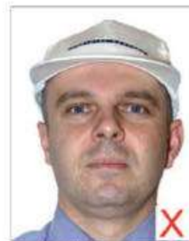
Port de casquette