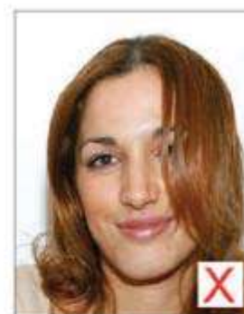
Visage non dégagé

Les yeux sont ouverts, le sujet fixant clairement l'objectif ; les cheveux ne doivent pas obscurcir les yeux.