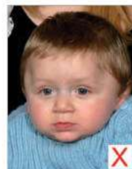
Autre personne présente

La photo doit représenter le sujet seul, sans dossier de fauteuil ou jouet visible par exemple. Le sujet doit regarder l'objectif en adoptant une expression neutre, bouche fermée.