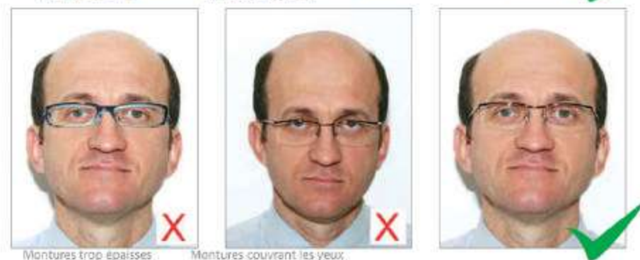
Montures trop épaisses

Eviter dans la mesure du possible les montures épaisses. Les montures ne doivent pas cacher les yeux.