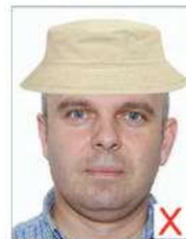
Port de chapeau