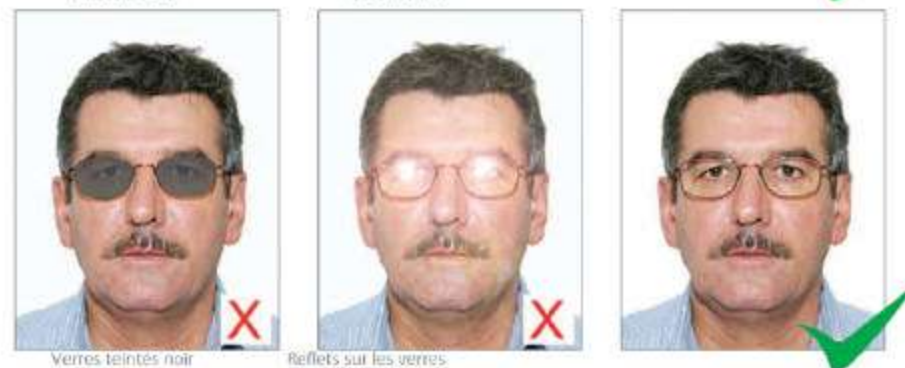
Verres teintés noir

Les yeux doivent être parfaitement visibles sans reflet de lumière sur les lunettes qui ne doivent pas être équipées de verres de couleur.