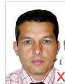
Traces / Plisures